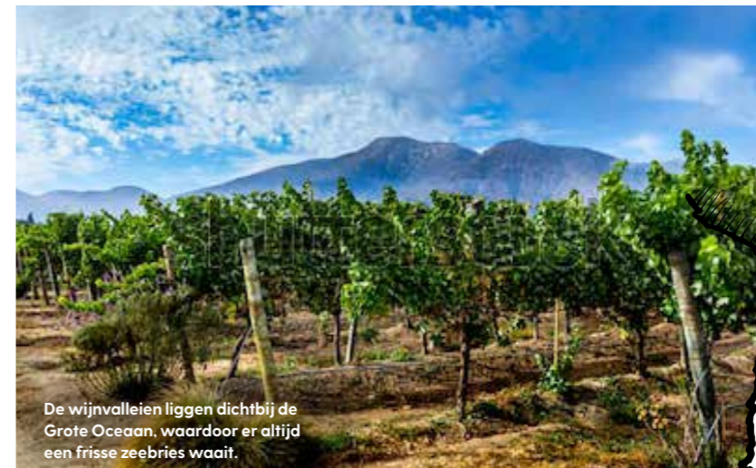
De wijnvalleien liggen dichtbij de Grote Oceaan, waardoor er altijd een frisse zeebries waait.