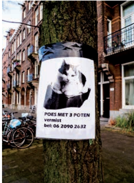
▲ Poes vermist!, 12 februari 2009.